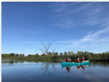
Kanadyjka na trasie

godz. 13.30-14.30 - wspólny obiad w Krajniku Dolnym