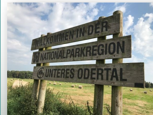
Tablica przy wejściu do Parku Narodowego Dolnej Odry_ Zdjęcie Anet Hoppe

„Innowacje i strategię w bran- ży turystycznej na przykładzie powiatu Uckermark”