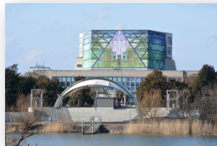
Uckermärkische Bühnen Schwedt

Miejsce: Dom Edukacji i Technologii (Haus der Bildung und Technologie, adres: Berliner Straße 52 e, 16303 Schwedt